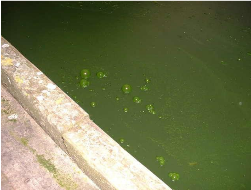
Algenblüte im Main