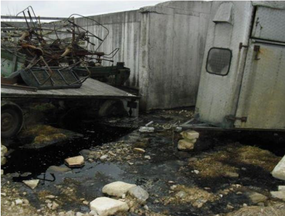
Austritt von Silosaft durch undichte Silowände