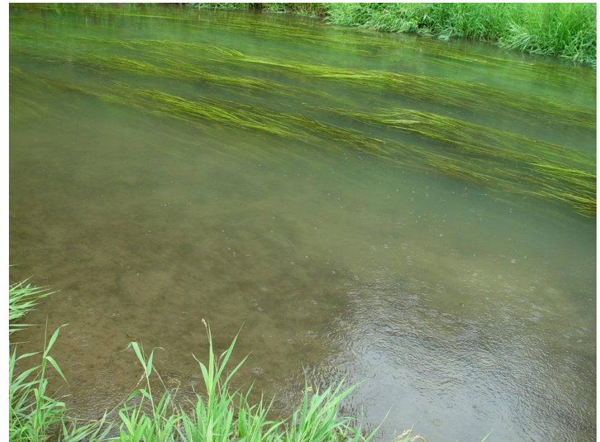
Verkrautung der Wiesent